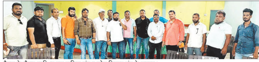
बैठक के दौरान उपस्थित ट्रक मालिक संघ व कोल लिफ्टर संघ के सदस्य।

सामुदायिक भवन में बैठक आयोजित की गई थी लेकिन बैठक बेनतीजा रही और कोल लिफ्टर का समर्थन नहीं मिलने से नाराज ट्रक मालिक संघ ने 20 अगस्त से