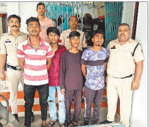
पुलिस गिरफ्त में आरोपी।