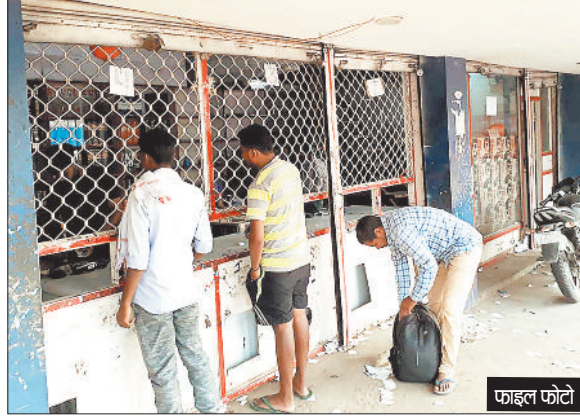
93 हजार 360 रुपए की देसी शराब और 1 करोड़ 14 लाख 27 हजार 950 रुपए की विदेशी शराब बेची गई है जबकि वहीं

से तोबा कर लिया था। यही वजह है कि शराब की बिक्री लगातार गिरते ही जा रही थी और करोड़ों में रोज बिकने वाली शराब लाखों तक आ पहुंची थी लेकिन जैसे ही सावन का महीना खत्म हुआ और भादो का महीना शुरू हुआ रक्षाबंधन की शाम से ही मदिरा प्रेमी शराब दुकान जा पहुंचे और शराब की बिक्री में अचानक उछाल दर्ज किया गया। आबकारी विभाग से मिली आंकड़ों के मुताबिक रक्षाबंधन के दिन ही आबकारी विभाग ने 2 करोड़ 10 लाख 21 हजार 310 रुपए की शराब बेची है। जिसमें 95 लाख