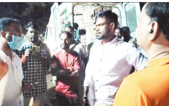
घटना की जानकारी लेते विधायक।

जिले में स्वास्थ्य सुविधाएं सुधरने का नाम नहीं ले रही है। इसका एक प्रमुख कारण समय पर मरीजों को एंबुलेंस की सुविधा नहीं मिलना है। रविवार की रात भी एकबार फिर मरीज को समय पर एंबुलेंस नहीं मिलने का मामला सामने आया है। सड़क दुर्घटना में घायल मरीज को रिफर किए जाने के बाद पिकअप में भरकर भेजा गया। बड़ी बात यह है कि विधायक के हस्तक्षेप के बाद घायल व्यक्ति को एंबुलेंस मिल पाया लेकिन इस लापरवाही के कारण विवाद की स्थिति निर्मित हुई। अब इस मामले में सीएमएचओ ने