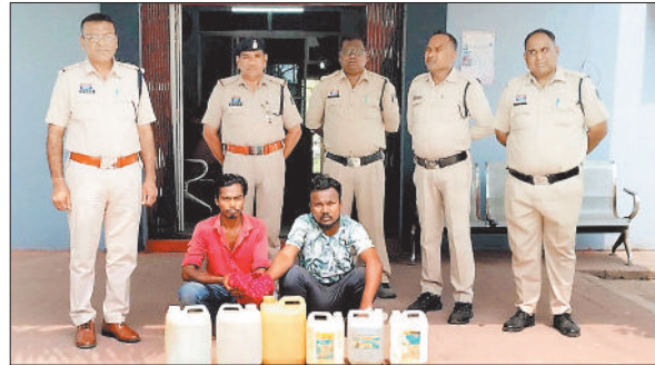
पुलिस गिरफ्त में आरोपी व जप्त शराब।