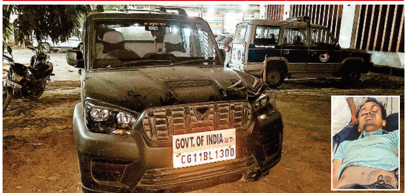
जब्त वाहन। इनसेट में घायल युवक।

स्वयं के खचें से ई रिक्शा में घायलों को लेकर सिम्स पहुंचाया। बताया जा रहा है कि ब्लैक कलर की स्कार्पियो क्रमांक सीजी 11 बीएल 1300 के चालक ने इस दुर्घटना के बाद भी अपनी गाड़ी नहीं रोकी और गोल बाजार की ओर भाग निकला, तिलक नगर के यातायात पुलिस के जवानों ने स्कार्पियो का पीछा किया। गोलबाजार में भी 3 लोगों को घायल कर चालक फरार हो गया। पुलिस ने स्कार्पियो को सिटी कोतवाली थाना पहुंचा दिया है।