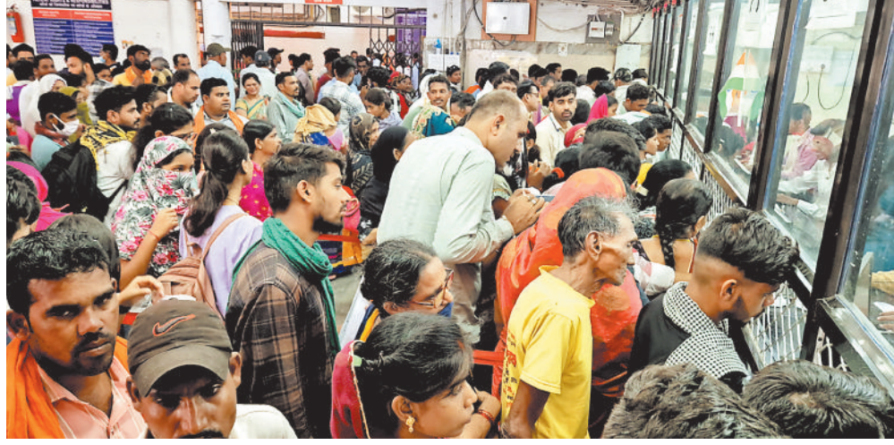
सोमवार को सिम्स के ओपीडी में पर्ची कटवाने लगी रही लंबी कतार।

लगातार दो दिनों की छुट्टी के बाद सिम्स में सोमवार को ओपीडी खुली, इस दौरान डाक्टर और स्टाफ मौजूद रहे, लेकिन भीड़ के आगे व्यवस्था बीनी नजर आई। इस दौरान मेडिसीन विभाग में 415, स्कीन में 316, न्यूरो विभाग में 225 और इंटीग्रेटिव विभाग में 246, गायनिक 361, आर्थो 189 व अन्य 284 मरीजों को दिखाने की सलाह दी गई। इस दौरान अधीक्षक डॉ लखन सिंह को बड़ोत्तरी के कारण पर्ची काटने और टोकन लेने का सिस्टम