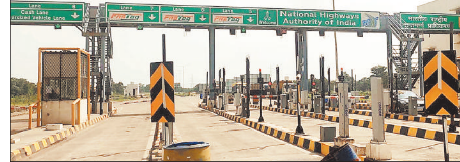
उरगा चांपा मार्ग में स्थित टोल नाका।

आवाजाही पर टोल टैक्स वसूलने की इतनी जल्दी है कि अधूरे सड़क के वाहनों से पूरे पैसे वसूल जा रहे हैं। टोल नाके में इसकी जानकारी लेने पर बताया गया कि 28 जून से टोल टैक्स की वसूली चालू कर दिया गया है जो अभी टॉल के रूप में किसी केसीसी कंपनी को टोल प्लाजा के संचालन व टैक्स वसूलने का टेंडर दिया गया है। टोल प्लाजा के संचालन में लगी केसीसी कंपनी द्वारा अधूरे सड़क की पूरे टैक्स वसूलने तथा केश लेन में फास्टेज स्कैनर लगाकर ऑनलाइन टैक्स वसूलने से आमजन काफी परेशान हो रहे हैं और इस पर अक्सर